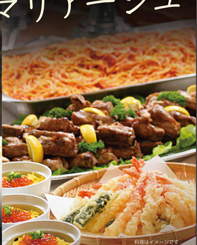
料理はイメージです