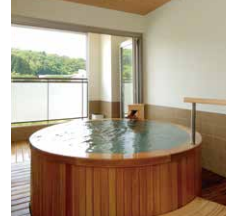
桜鏡(さくらかがみ)

ご家族やお友達 大切な方と プライベートな空間で 温泉をお愉しみいただけます。 癒しのひとときを ゆつたりとお過ごしください。