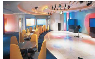
カラオケ「タイムカプセル」