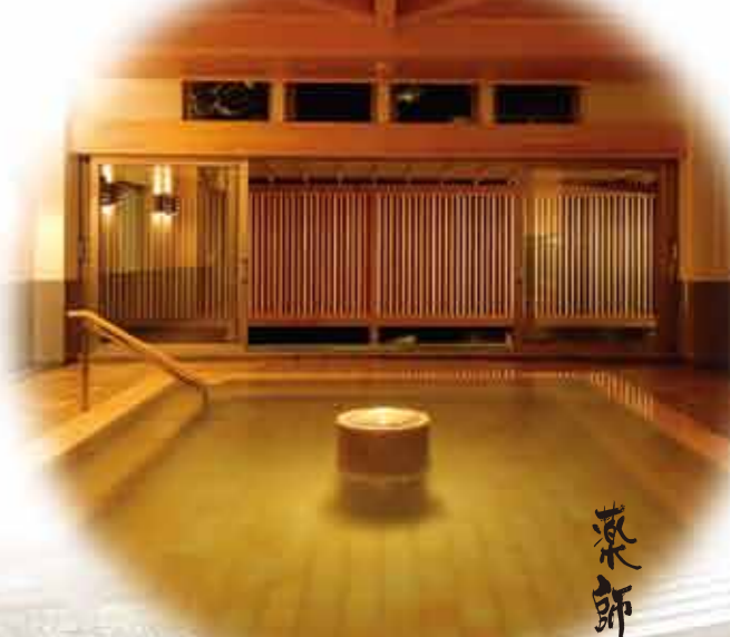
薬師の湯の「水心鏡」