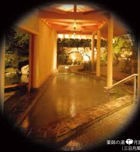
薬師の湯 月宮殿 (三日月風呂)