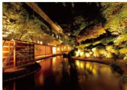
ライトアップされた庭園